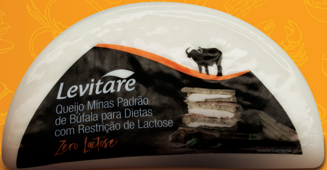
Queijo Minas padrão 20043