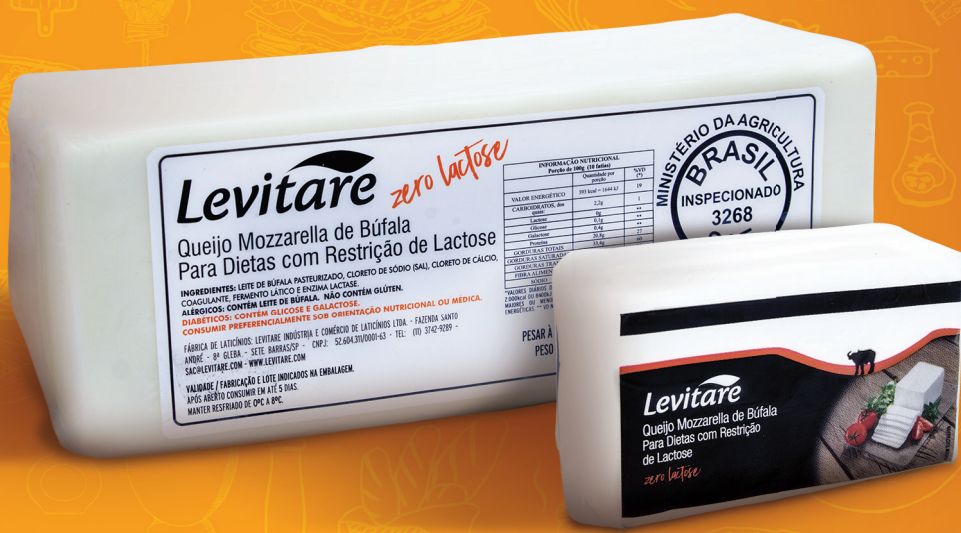
Barra lanche 500g 20041