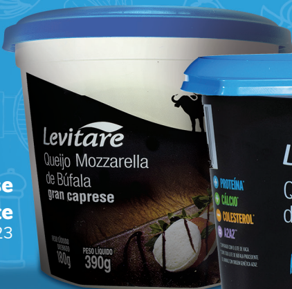
Gran Caprese pote 20023