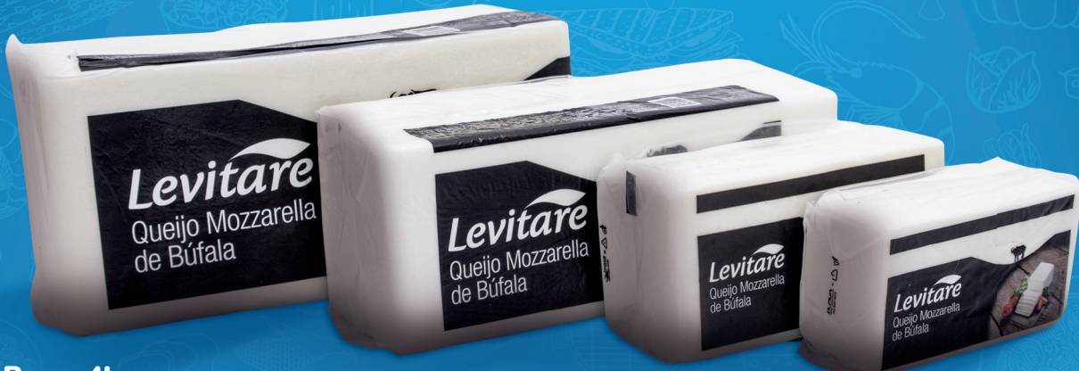
Barra 4kg 20001