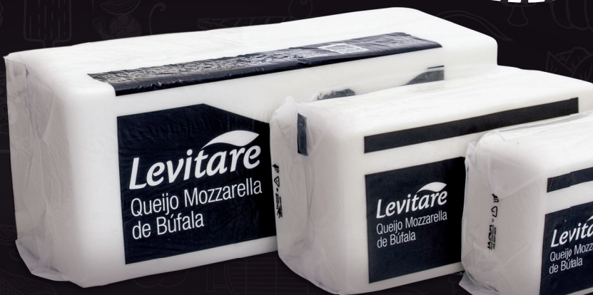
Barra 2,5kg 20060