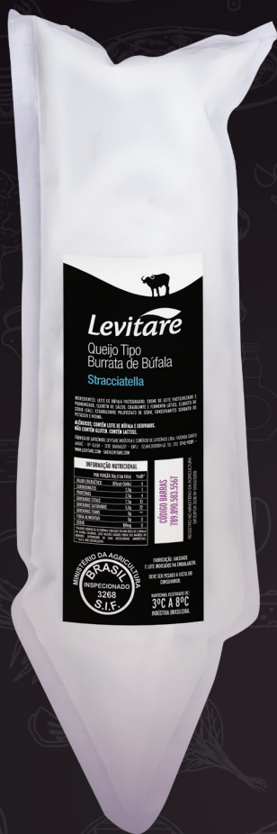
Stracciatella Creme de burrata 20053