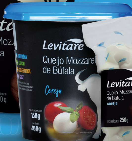
Cereja pote 20032